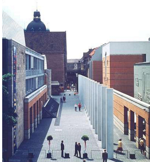
Nürnberg, Straße der Menschenrechte

State-of-the-art und wissenschaftliche Symposien (inkl. Symposium der AIM), Fortbildungskurse und -workshops, Arbeitsgruppen.